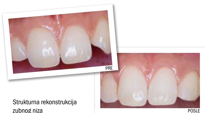
Strukturalna rekonstrukcija zubnog niza

Osmeh čine usne, zubi i desni. Zamislite Da Vinčijevu sliku Mona Lize u običnom drvenom ramu!? Tako je i sa zubima - i oni izgledaju lepše uokvireni zdravim, lepim i harmoničnim desnima.