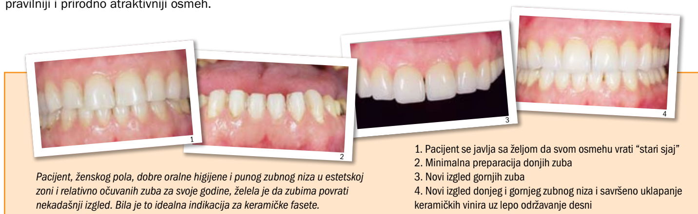
Pacijent, ženskog pola, dobre oralne higijene i punog zubnog niza u estetskoj zoni i relativno očuvanih zuba za svoje godine, želela je da zubima povрати nekadašnji izgled. Bila je to idealna indikacija za keramičke fasete.

Postavljanje keramičkih faseta zahteva preciznost, veštinu, talenat i umetničku viziju krajnjeg ishoda kako stomatologa tako i zubnog tehničara. U vrlo tankom sloju keramike moraju se sabrati sve optičke karakteristike koje želimo da ukomponujemo u konačni izgled zuba. Dinamične promene u tehnologiji materijala za izradu zahtevaju i stalnu edukaciju i usavršavanje celog terapijskog tima.